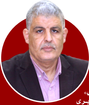
كلمة مدير الجامعة أ.د. عمر فرحاتي

ها هو العدد الثاني من مجلة «جامعة الوادي» الإعلامية يرى النور بقيمة مضافة